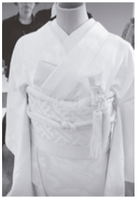
～花嫁の営業コース～