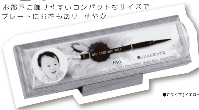
●Cタイプ(イエロー) スタンドタイプ