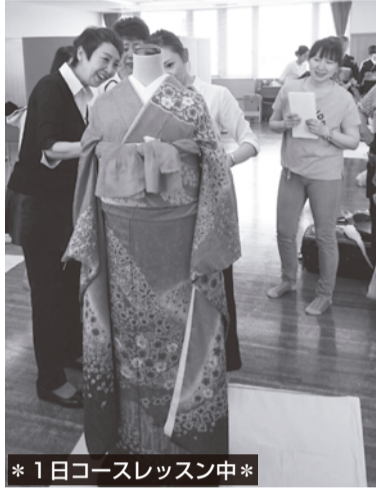
*1日コースレッスン中*

詳細は、岡山県美容組合のホームページをご確認いただくか、県組合事務所（TEL086-222-3221）までお問い合わせ下さい。