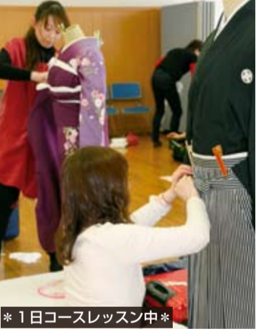
*1日コースレッスン中*