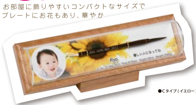
●Cタイプ(イエロー) スタンドタイプ