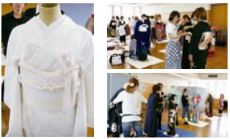
~花嫁の営業コース~

詳細は、岡山県美容組合のホームページをご確認いただくか、県組合事務所 (TEL086-222-3221)までお問い合わせ下さい。